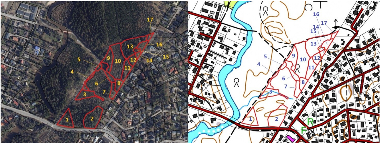
11 . Varttunutta, lehtopohjaista, luonnontilaisen kaltaista metsää. Samaa arvokasta kokonaisuutta viereisten kohteiden kanssa.